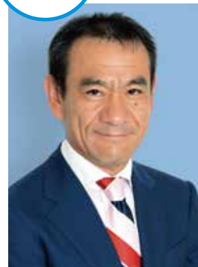
メットライフ生命保険株式会社 執行役員 常務 代理店ビジネス担当 本部長