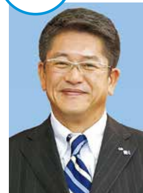
メットライフ 全国代理店会連合会 会長